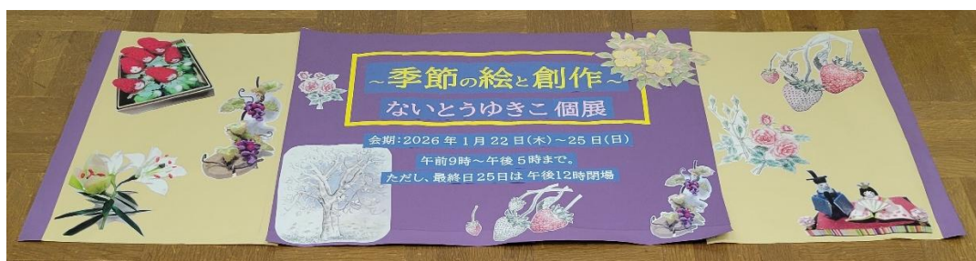
↑(3)の例 協力：ないとうゆきこ氏