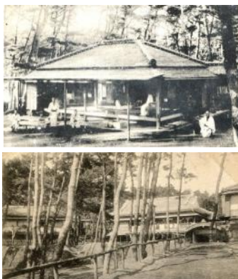
海気館 上は「離れ」。現代でいうコテージのようだ。下は本館および新館と思われる建物。

今では行楽や遊びの一環として海で泳ぐのが一般的ですが、当時の海水浴場は、「海気」(海水や海辺の空気など)による病気の諸治療や健康増進などがうたわれ、温泉による湯治場のようなものだったと考えられます。海水浴によって治療効果があるとされた病気には、脚気・肺病・梅毒・神経諸病・貧血性などなどが挙げられ、患者は医師の指示の下で海水浴を行っていました。