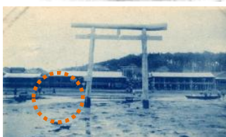
一の鳥居 上が昭和の中頃。下が大正時代。鳥居の脇に岩があるが、大正時代にはなんと見られない!

ある人によると、大昔に稲毛と検見川の神様が喧嘩をして、負けた稲毛の神様を葬った岩、またある人によれば、海に葬られそうになった稲毛の神様を助けたコハダという魚を祀った岩だとも…。この真相を探るべく、昭和の初めから稲毛に住む方にお話を伺ったところ、どうやらあの岩は富士山の溶岩なのだそうです。富士山信仰の浅間神社にちなんで運ばれてきたのでしょうか。この岩と祠は今も国道14号線沿い、浅間神社の向かいに見ることが出来ます。