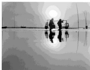
よとほし漁 遠浅の稲毛海岸では、潮が引き広大な干潟が出る新月の夜に、カンテラを灯しながら、小エビや小魚をとり遊びに出かけた。この狐の話も、夜に海上を歩いたということから、よとほし漁の最中だったようだ。

稲毛では秋の夜長の季節になると、漁好きの人たちは夜中に稲毛海岸浜に出かけた。カレイやハゼが大漁で、肩に掛けた籠が重くなり、そろそろ帰ろうと陸に向かって歩きはじめますが、いつまでもたっても陸に上がれず、時間ばかりが過ぎていった…。ついに東の空が明るみ、周囲を見渡すと、そこはなんと隣町、ときにはさらに隣の登戸海岸や幕張海岸だったそう。そして、大量だった籠の中の魚は、いつの間にかからっぽになっていった。古老たちは「きつね」に化かされたのだという。海幸彦(みぎやまひこ)の歴史