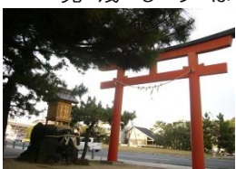
昨年閉店した「手打ちそば せんげん」の駐車場に、鳥居と並んで祀られている岩。かなり大きい。

ある人によると、大昔に稲毛と検見川の神様が喧嘩をして、負けた稲毛の神様を葬った岩、またある人によれば、海に葬られそうになった稲毛の神様を助けたコハダという魚を祀った岩だとも…。この真相を探るべく、昭和の初めから稲毛に住む方にお話を伺ったところ、どうやらあの岩は富士山の溶岩なのだそうです。富士山信仰の浅間神社にちなんで運ばれてきたのでしょうか。この岩と祠は今も国道14号線沿い、浅間神社の向かいに見ることが出来ます。